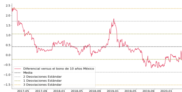
Diferencial Bono de 10 años vs Tasa de Fondeo Actual (%)